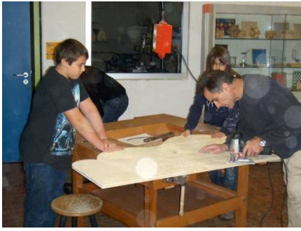
Der Schneemann – Bau! Schüler beim Sägen und Schleifen!