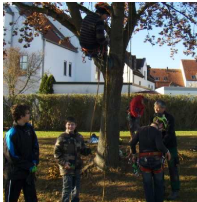
Gesichertes Klettern auf Bäume zum Beschneiden der Äste!