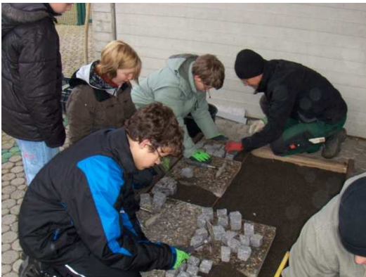
Schüler beim Pflastern!