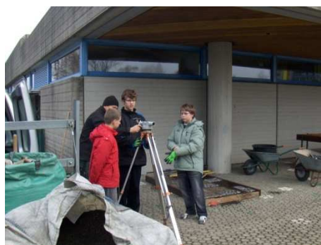
Vermessung mit Spezialgeräten!