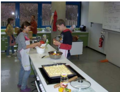
Backe, backe Kuchen...